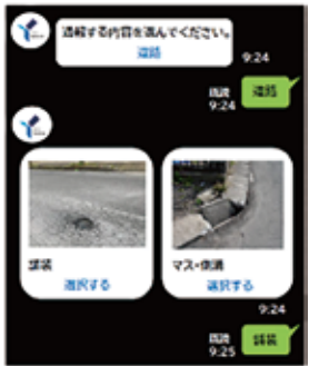
通報システム画面(イメージ)

市民の皆様が、スマートフォンから簡単な操作で、道路の破損をいつでも通報できるようにします。LINEの横浜市公式アカウントから、舗装の穴やカーブミラーの不具合等を選択式で入力、写真や地図も添付でき簡易に通報できるものです。一昨年から提案していたのですが、この4月中に利用が開始されます。